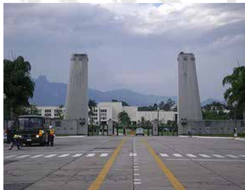
Entrada principal da Academia Militar das agulhas Negras