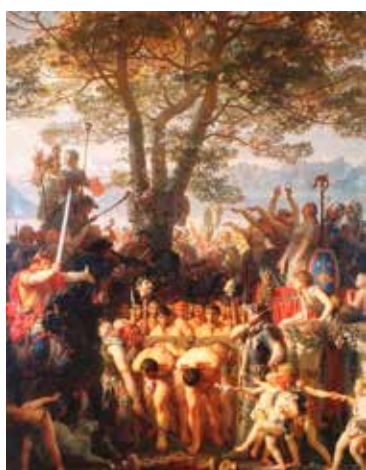
Imagem nesta página:

Cesar Machado Domingues Editor Responsável.